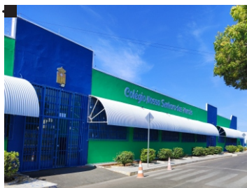
Colégio Nossa Senhora das Mercês Fundação: 02/09/1937