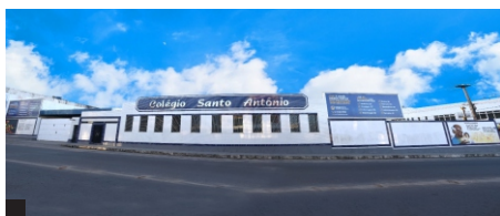
Colégio Santo Antônio de Jesus Fundação: 24/05/1947