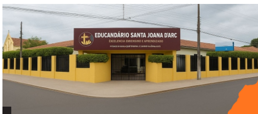
Educandário Santa Joana D'Arc Fundação: 09/03/1951