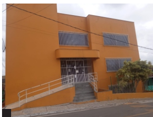
Obra social Santa Madalena Fundação: 21/04/1979