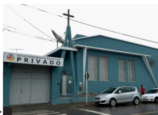
Comunidade de Evangelização Dom Inocêncio Fundação – 24/05/1947