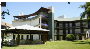
Centro de Formação N. S. das Mercês Fundação: 13/05/1998