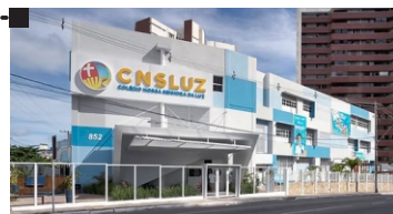
Colégio Nossa Senhora da Luz Fundação: 28/07/1958