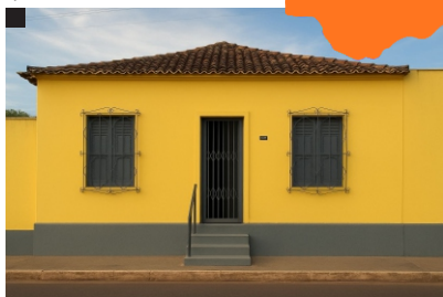
Comunidade de Evangelização São José Fundação: 28/03/1957