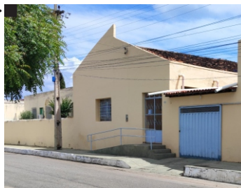
Comunidade de Evangelização Nossa Senhora das Mercês Fundação: 02/09/1937