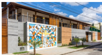
Comunidade Cenáculo Madre Lúcia Fundação: 02/05/1999