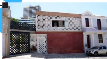
Casa Geral Fundação: 31/08/2025